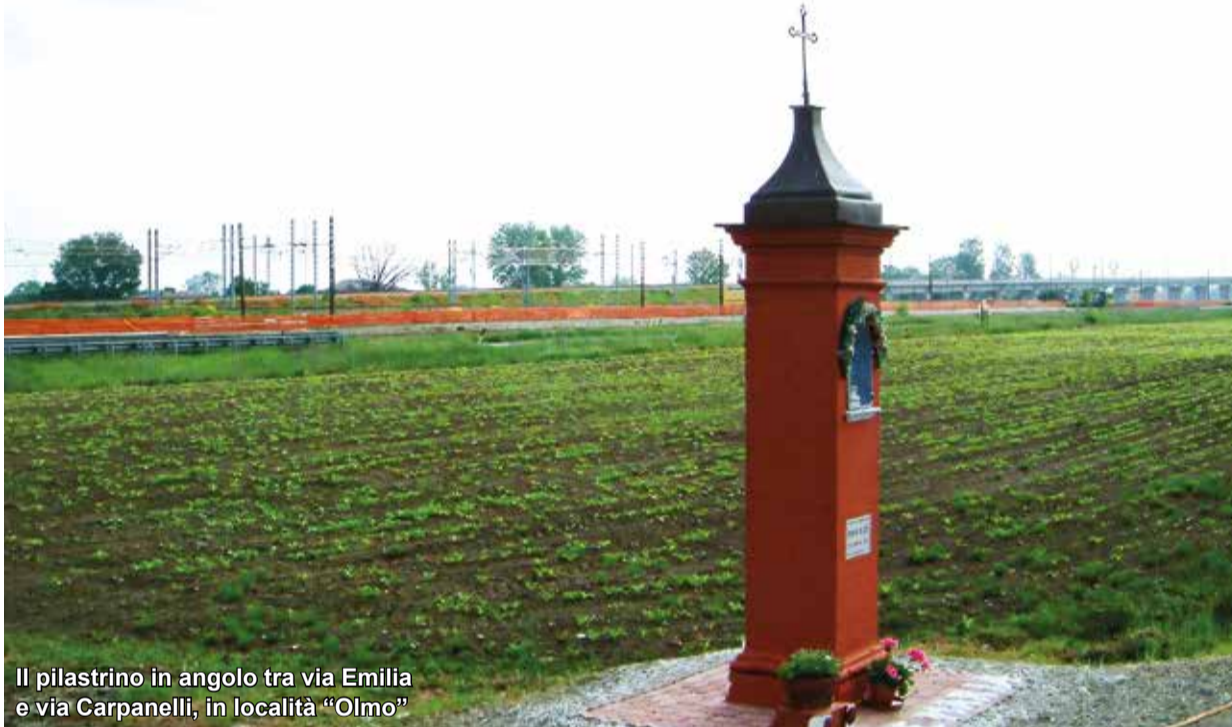
Il pilastrino in angolo tra via Emilia e via Carpanelli, in località "Olmo"

ri", era non solo rispettata e riconosciuta dalla Chiesa parrocchiale di Anzola, ma i pilastrini erano anche meta delle processioni in occasione delle maggiori festività cristiane, o nei giorni delle "rogazioni" (i riti per invocare la benedizione del Signore sulla fecondità dei campi). Centro Culturale Anzolese