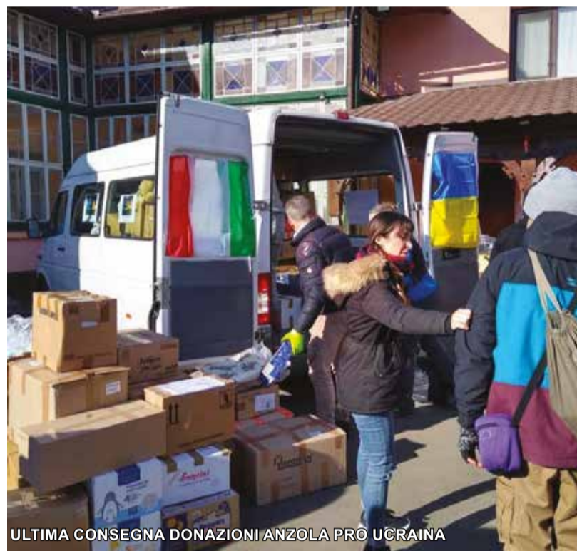
ULTIMA CONSEGNA DONAZIONI ANZOLA PRO' UCRAINA

Per info/donazioni: Cell. 3493783134 Ambientiamociodv@gmail.com