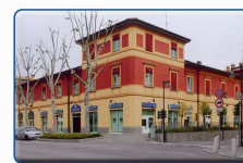
La Casa del Popolo di Anzola dell'Emilia

Realizzati con il contributo della Coop Casa del Popolo