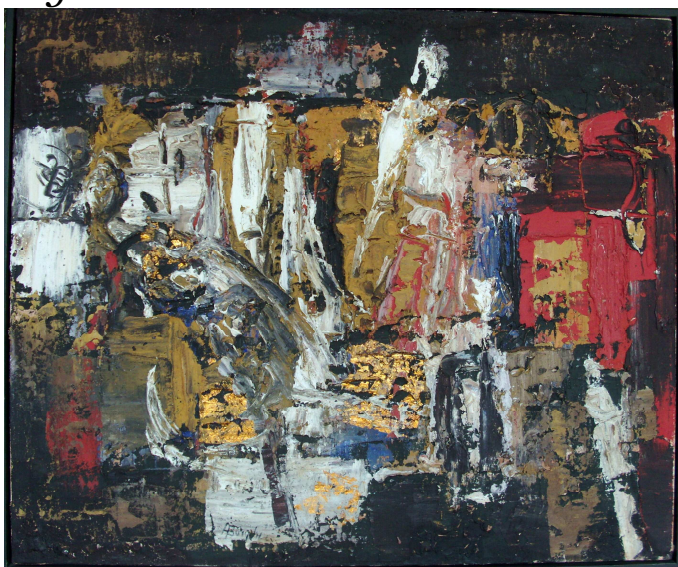
Opera di Alfonso Borghi